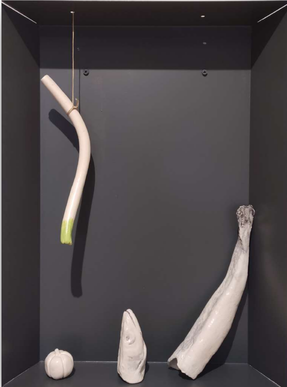
Naturaleza muerta con pescadilla, puerro y ajo Acero galvanizado lacado y cerámica esmaltada 80x60x15 cm 2025