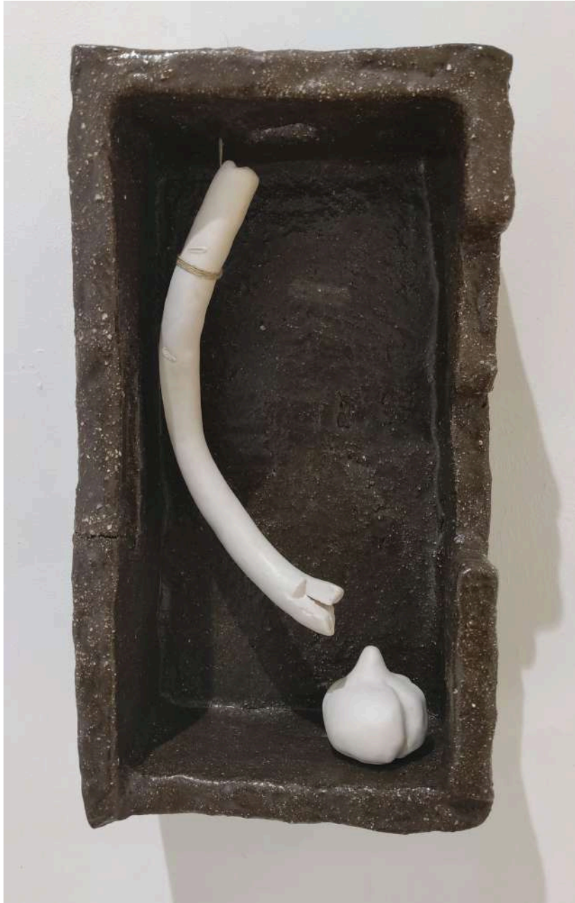
Naturaleza muerta con puerro y ajo Cerámica esmaltada 30x17x12 cm 2025